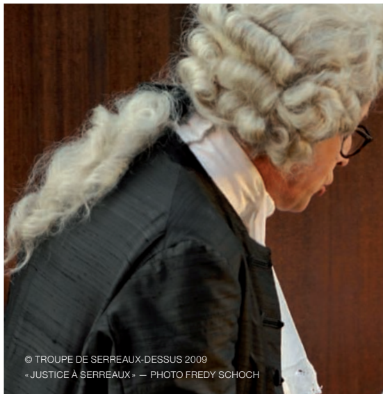
© TROUPE DE SERREAUX-DESSUS 2009 « JUSTICE À SERREAUX » — PHOTO FREDY SCHOCH

Les groupes de musique — encore plus nombreux — n'ont pas tous un local garanti et, surtout, adapté. Les plasticiens, les réalisateurs ou les photographes manquent aussi de lieux de création.