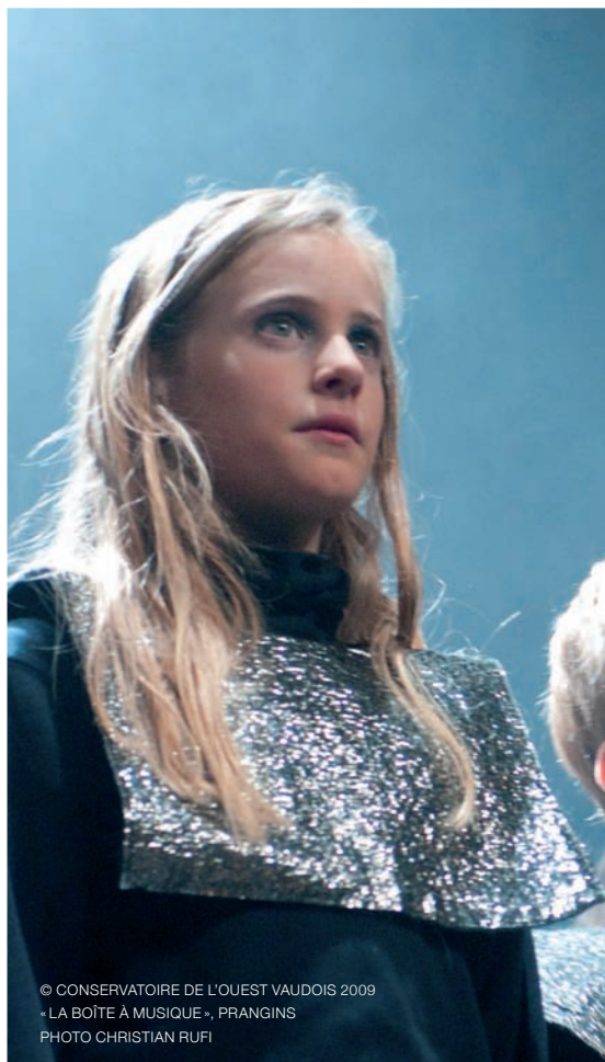
© CONSERVATOIRE DE L'OUEST VAUDOIS 2009 - LA BOÎTE À MUSIQUE -, PRANGINS PHOTO CHRISTIAN RUF

La vie villageoise doit être préservée, elle évolue en parallèle de l'activité culturelle qui dépasse parfois les frontières communales. Par exemple, les bibliothèques, en plus de leur fonction intellectuelle, maintiennent un lien social entre les habitants d'une commune.