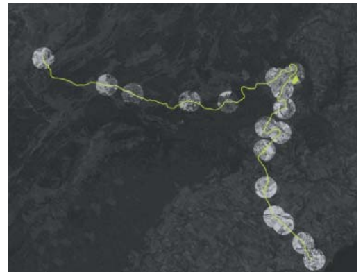
Le tracé du Nyon-Saint-Cergue-Morez et le chapelet des haltes (étude-test du projet d'agglomération franco-valdo-genevoise - Atelier TEAM+)

et améliorer le quotidien de ses habitants. Désormais, on dit les «villages du Nyon-Saint-Cergue», la ville de Nyon restant un peu à l'écart car son identité millénaire repose sur d'autres paramètres, Morez de même pour d'autres raisons : la frontière, le démantèlement de la voie ferrée.