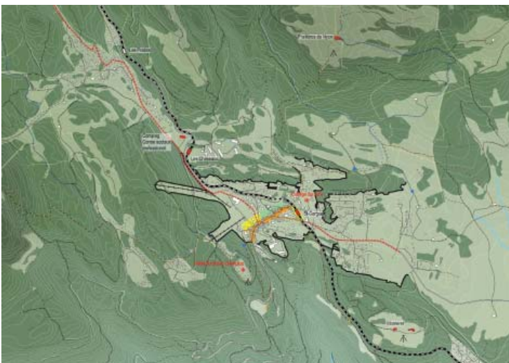
Le bâti inséré dans la nature - Saint-Cergue (étude-test du projet d'agglomération franco-valdo-genevois 2008-2009 - Atelier ADR)

Cette relation s'est renforcée avec le temps et la complexification des enjeux d'organisation du territoire, et culmine aujourd'hui dans la reconnaissance de cette entité comme région cohérente dessinée par un schéma directeur intercommunal. L'usage de la voiture omniprésent – et depuis longtemps – n'a pas généré cette identification à un territoire que le rail dans son essentialité et sa contrainte incontournable de tracé a imposé. Et les chemins de fer régionaux, après des décennies de déconsidération, jouent à nouveau le rôle de déclencheur de l'urbanisation, même modeste dans ces lieux villageois, mais tout de même générateur de développement dans les cœurs de localité et près des arrêts.